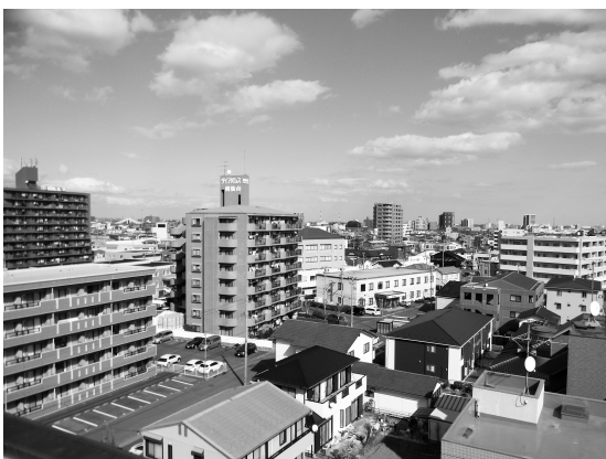
現在の柳生2丁目方面 チサンマンション屋上から撮影